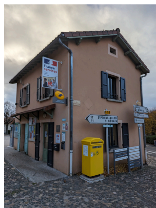
Réalisation L'Agenza - Ne pas jeter sur la voie publique

siaugues-sainte-marie@france-services.gouv.fr